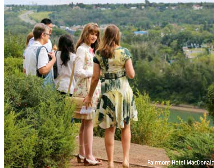
Fairmont Hotel MacDonald

In het klassieke Fairmont Hotel MacDonald kun je niet alleen op stand slapen maar ook klassiek brunchen. Grootheden zoals Paul McCartney, koningin Elizabeth II en Bill Clinton brachten de nacht hier door en schoven aan tafel. Mocht je geen cash flow hebben voor een kamer of voor het onder locals populaire buffet op zondag (circa € 50), dan is er altijd nog gelegenheid voor een borrel op het dakterras, met fijn uitzicht over de stad. Fairmont Hotel MacDonald, 10065 100 St NW, tel. 780-424-5181, fairmont.com.