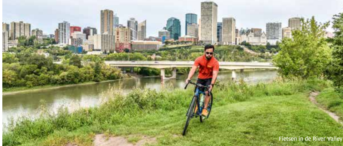
Fietsen in de River Valley

De inwoners van Edmonton hebben het grootste stadspark van Canada voor de deur liggen. De River Valley is een verzameling van maar liefst twintig parken en 160 kilometer aan trails om te hiken, fietsen en zelfs langlaufen. Je kunt daarbij in bossen en zelfs ravijnen belanden. Bij River Valley Adventure huur je een mountainbike voor maximaal € 43 per dag. River Valley Adventure , 9735 Grierson Hill NW, tel. 780-9957347, river-valleyadventure.com .