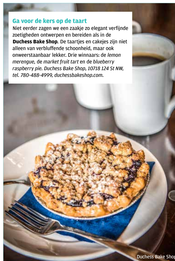
Duchess Bake Shop

Niet eerder zagen we een zaakje zo elegant verfijnde zoetigheden ontwerpen en bereiden als in de Duchess Bake Shop . De taartjes en cakejes zijn niet alleen van verbluffende schoonheid, maar ook onweerstaanbaar lekker. Drie winnaars: de lemon merengue , de market fruit tart en de blueberry raspberry pie . Duchess Bake Shop, 10718 124 St NW, tel. 780-488-4999, duchessbakeshop.com.