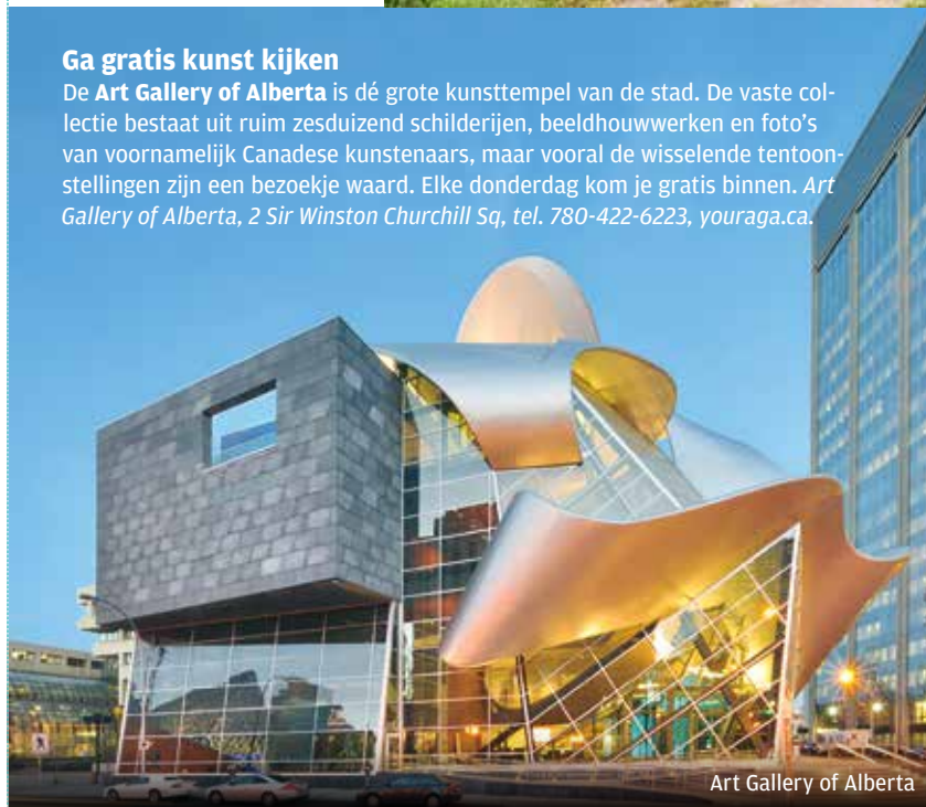
Art Gallery of Alberta

De Art Gallery of Alberta is dé grote kunsttempel van de stad. De vaste collectie bestaat uit ruim zesduizend schilderijen, beeldhouwwerken en foto's van voornamelijk Canadese kunstenaars, maar vooral de wisselende tentoonstellingen zijn een bezoekje waard. Elke donderdag kom je gratis binnen. Art Gallery of Alberta , 2 Sir Winston Churchill Sq, tel. 780-422-6223, youraga.ca .