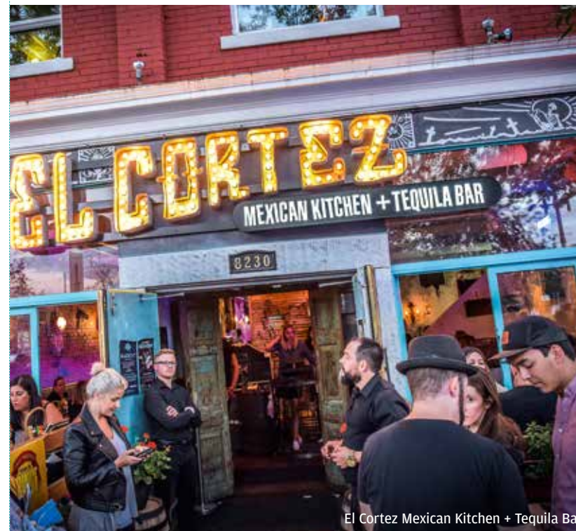
El Cortez Mexican Kitchen + Tequila Bar

Bij de sfeervolle El Cortez Mexican Kitchen + Tequila Bar kun je prima Mexicaans eten, maar de belangrijkste reden om hier aan te kloppen is de eindeloze lijst aan tequila's. Op donderdag zijn alle tequila's halve prijs. Ga voor de Ocho. Man, wat een smaak! Op warme zomerdagen is het gezellig borrelen op het binnenplaatsje. Geen tequilafan? Loop dan binnen op Margarita Monday! El Cortez Mexican Kitchen + Tequila Bar , 8230 Gateway Blvd, tel. 780-760-0200, elcortezcantina.com .