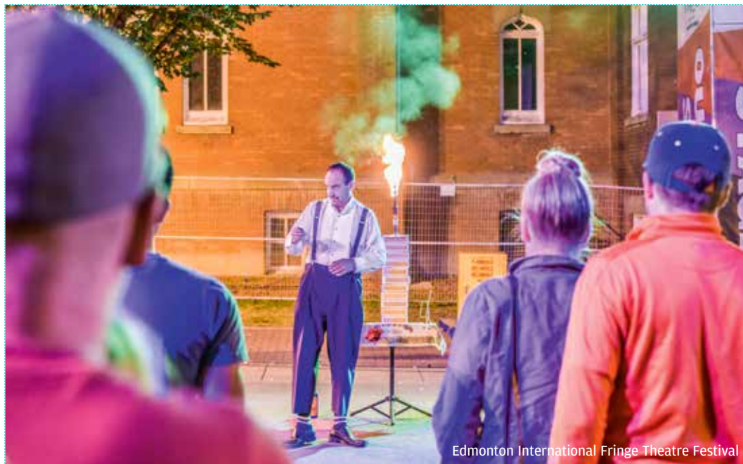
Edmonton International Fringe Theatre Festival