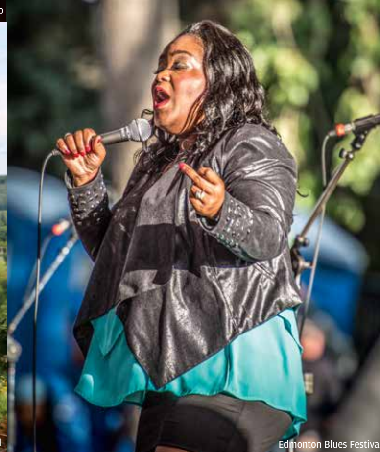
Edmonton Blues Festival

Elke augustus zingen tientallen rasartiesten zoals Jack de Keyzer en Shemekia Copeland met lichaam en ziel op het Edmonton Blues Festival . Drieduizend liefhebbers komen vanuit de hele wereld overvliegen om die rauwe stemmen te beluisteren – ze dringen recht je hart in. De akoestiek is uitstekend in het amfitheater van Hawrelak Park, waar je ook geweldig kunt picknicken als de muziek je minder weet te boeien. Toegang € 35 per dag, € 70 voor het hele weekend. Edmonton Blues Festival, bluesinternationaltd.com.