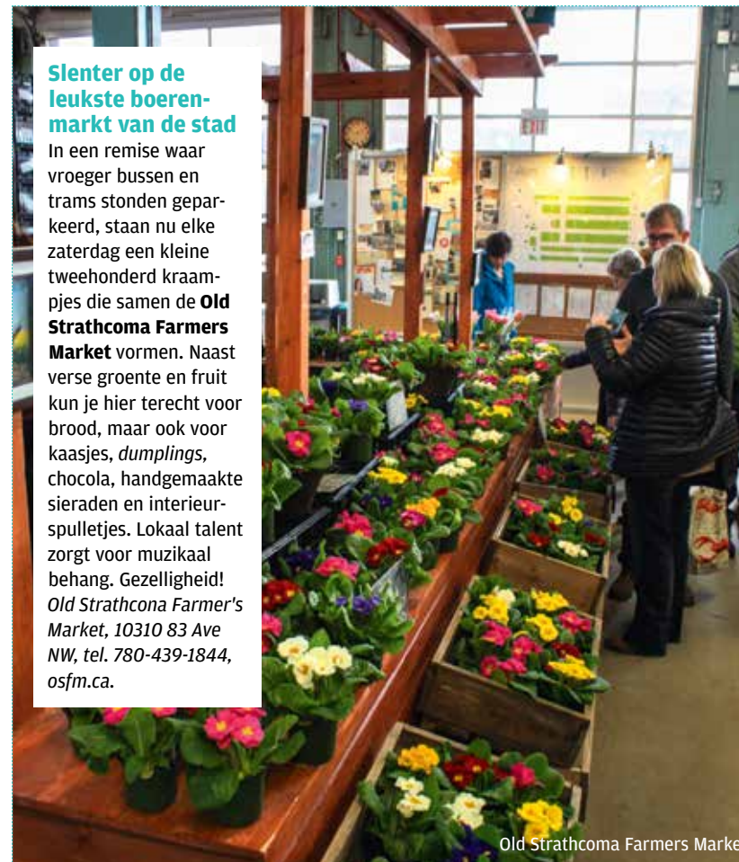
Old Strathcona Farmers Market