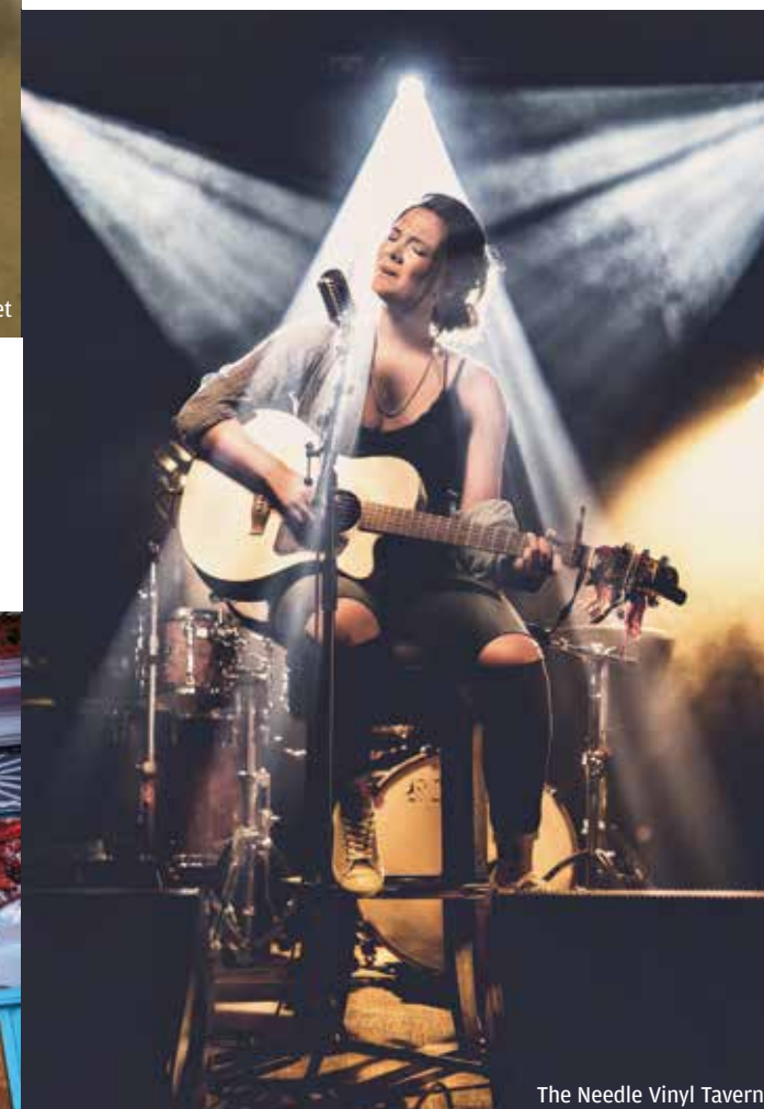
The Needle Vinyl Tavern

Liefhebbers van de Indiase en Pakistaanse keuken weten het Remy Café te vinden. Niet alleen voor de vele lekkere wraps (volop vlees- en vega-opties) maar ook voor de maar liefst 120 verschillende soorten thee. Grote favoriet is de chai, naar geheim huisrecept. Remy Café , 10279 Jasper Ave, tel. 780-757-7720, remedycafe.ca .