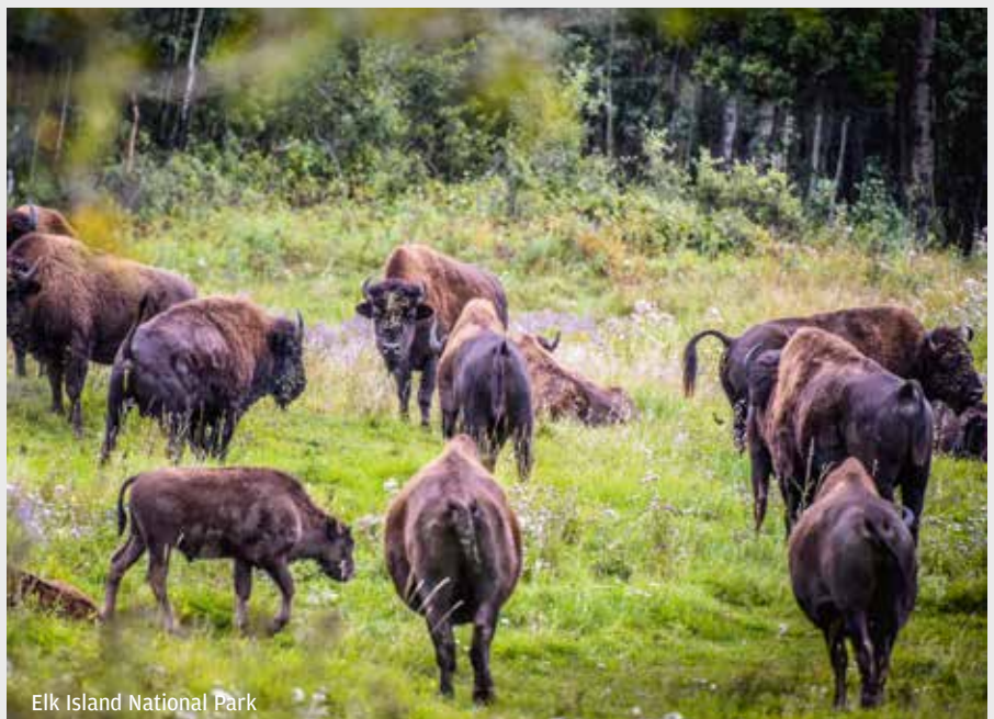
Elk Island National Park

Haal jouw bestemming dichtbij met Swarovski Optik