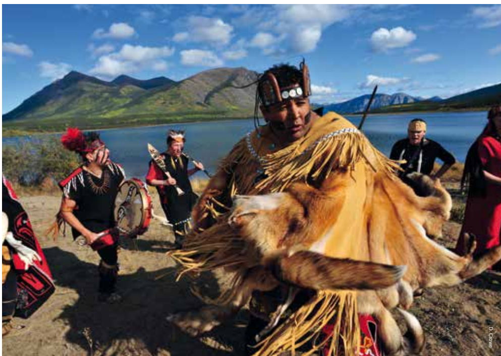
De Dakka' Kwa'an Dancers in Carcross

tember perfect voor prachtige rondreizen, maar daarna gaan veel campings dicht en kan de winter zijn intrede doen. Voor de ideale wintervakantie zijn de maanden januari tot en met april geknipt om te reizen. Maar in welk jaargetijde je ook op pad gaat, vergeet niet om een stukje te onthaasten. Blijf ook eens twee of meer dagen op één plek om het natuurschoon op je laten inwerken en te genieten van dit zuivere gebied zonder geluidsoverlast en lucht-, licht- en horizonvervuiling. Het is allemaal puur natuur, en toch zo goed bereikbaar. Waar tref je dit nog?