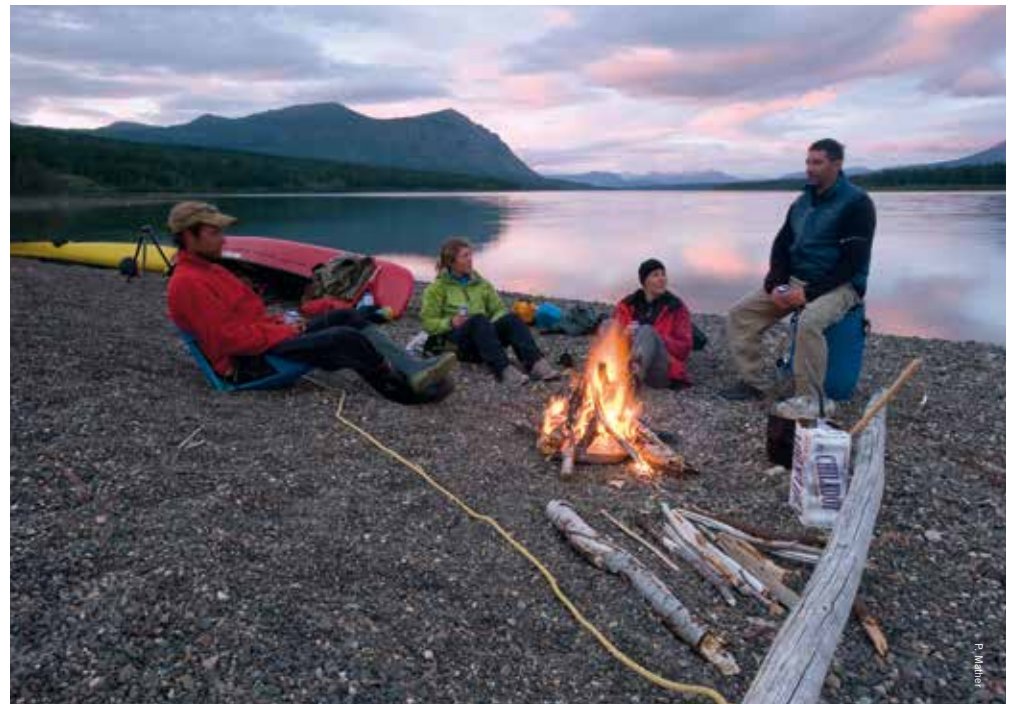
Kajakken bij Tagish Lake

deze majestueuze beesten in het wild tegenkomt. Maar ook berggeiten, grizzlyberen, kariboes, bizons, en vele soorten vogels zijn hier in groten getale te vinden. Uiteraard is het wel van belang om in ogenschouw te nemen dat het hier wilde beesten betreft, dus enige voorbereiding over hoe te reageren als bijvoorbeeld een beer op het pad staat, is wel belangrijk. Maar of je nu met de kano, kajak, fiets of te voet rondtrekt, je zult een heel ander beeld krijgen van Yukon. Dit zijn de herinneringen die je altijd bij zullen blijven, want het Yukon-gevoel is haast als een koorts. Maar dan geen goudkoorts, maar Yukon-koorts.