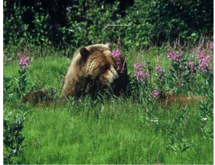
Grizzlyberen kun je overal in Yukon tegen het lijf lopen

het fraaie informatiecentrum herbergt een schat aan informatie over de geschiedenis van het park en haar bewoners. Een must see . Tot slot nog een speciale vermelding voor de 750 kilometer lange Dempster Highway, die Dawson City verbindt met Inuvik in de Northwest Territories en halverwege de Poolcirkel passeert. In de zomermaanden is deze onverharde weg, gebouwd op de permafrost, prima te bereizen met een auto of camper. Deze route brengt je echt in het hart van de bergketens en vele rivieren, die worden omgeven door de uitgestrekte toendra. In de zomer, maar zeker in de wintermaanden zijn een goede voorbereiding én het juiste vervoersmiddel wel van belang. Hoe dan ook, dit is met recht een van de laatste echte wildernisgebieden ter wereld en is nog relatief makkelijk toegankelijk ook.