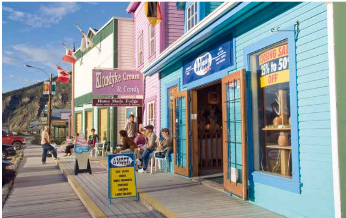
Dawson City, een plaats waar de tijd lijkt te hebben stilgestaan

waant je ook hier met recht in een openlucht-museum. En vlak bij de plaats ligt ook nog eens een woestijnlandschap! De levende geschiedenis is ook terug te vinden bij de Silver Trail van Mayo naar Keno; hier waan je je op een filmset met z'n prachtig heropende saloon, b&b en natuurlijk Keno Hill. Maar Whitehorse is toch met recht de 'grote' stad. In eerste instantie is het even wennen als je hier binnenrijdt, want er zijn zelfs stoplichten (bijzonder in Yukon!) en alle voorzieningen die je als reiziger ook maar kunt wensen. Kortom, een ideale uitvalsbasis voor een