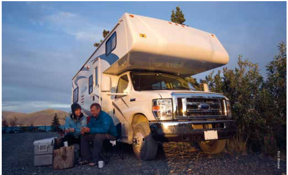
Ontspannen bij je eigen camper

Yukon lijkt te zijn gemaakt om met de camper rond te reizen en te overnachten op een van de vele prachtige (natuur)campings en RV Parks. Maar ook zelf met de auto op pad gaan en overnachten in bijzondere lodges en b&b's of zelfs fly-in lodges te bezoeken is zeer populair. Campers worden in Whitehorse aangeboden door Fraserway RV en Canadream. In de hoofdstad is het eenvoudig manoeuvreren met de camper en zodra je de hoofdstad verlaat, gaat er een wereld voor je open. De levensader voor Yukon is de Alaska Highway, die bij Watson Lake Yukon binnenkomt vanuit British Columbia en bij Beaver Creek de provincie verlaat voor Alaska. De in totaal 2.237 kilometer lange Alaska Highway voert 892 kilometer door Yukon en verbindt acht kleine gemeenschappen, een nationaal park, belangrijke bezienswaardigheden en de hoofdstad Whitehorse met elkaar. De historie van de totstandkoming van de weg is net als de goudkoorts een fascinerend verhaal. De weg werd in 1942 aangelegd om Alaska vanuit de zuidelijke Verenigde Staten ( Lower 48 ) over de weg te kunnen bereiken. Er waren al langer plannen om dit te realiseren, maar na het Japanse bombardement op Pearl Harbor in december 1941 kwamen deze plannen in een stroomversnelling. Met de aanleg werd op 9 maart 1942 begonnen en nog geen acht maanden later, op 25 oktober 1942 was de weg al klaar. Een huzarenstukje. Dé auto- en campertour door Yukon is de 1.435 kilometer