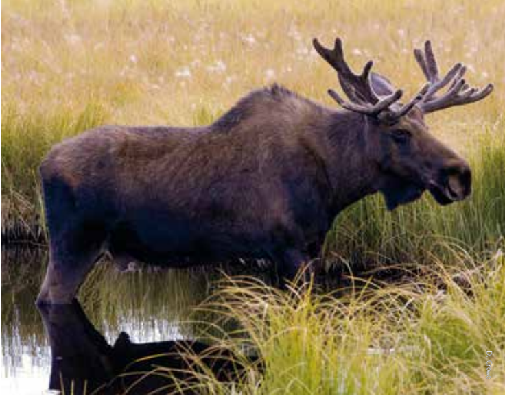
Elanden blijven majestueuze beesten