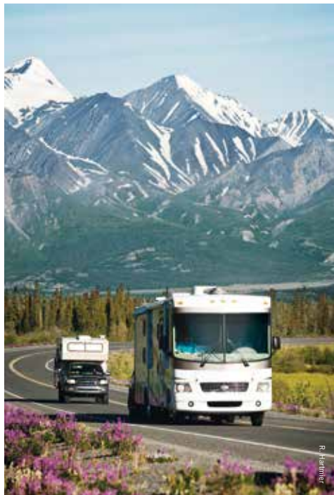
Met de camper cruisen door Yukon

lange Klondike/Kluane Loop, die de vroegere goudvelden met de prachtige natuur van Kluane National Park en indrukwekkende wegen als de Top of the World Highway verbindt. Op wat tegenliggers na, die op één hand te tellen zijn, lijkt het al snel alsof je alleen op het dak van de wereld rondrijdt. Vergeet ook niet te stoppen bij het Kluane National Park, een van de mooiste natuurgebieden van Yukon. Niet voor niets riep de UNESCO Kluane uit tot Werelderfgoed. Haines Junction is hierbij de uitvalbasis voor mooie korte of zelfs meerdaagse wandelingen;