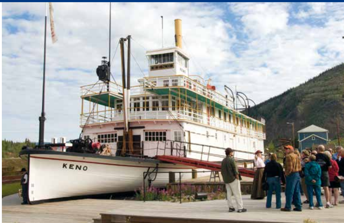
Met een rondleiding bij de SS Keno: levende geschiedenis!