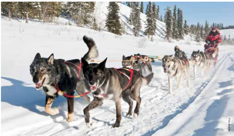
Met de hondenslede op stap is een droom van elke bezoeker aan Yukon tijdens de wintermaanden

waarin er wordt gereisd, want alle vier jaargetijden zijn verschillend én mooi op zichzelf. De winters zijn lang en koud, maar fascinerend. Met een goede voorbereiding is het hier goed uit te houden. Stap op je eigen hondenslede, die jezelf ment met vier, vijf of zes honden voor een middag of zelfs voor meerdere dagen. Bindt de sneeuwschoenen onder voor een heerlijke wandeling door de natuur. Of ga lekker racen met een sneeuwscooter door de bossen en over bevroren rivieren. Het kan hier allemaal. Een grote kans ook, dat het Noorderlicht ( Aurora Borealis ) te zien is, want Yukon is een van de